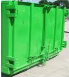
Apertura puerta en 2 hojas

PANAMERICANA NORTE 20514-LAMPA-SANTIAGO FONO:+5629642020