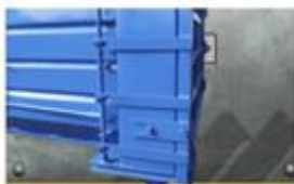
Sistema de cierre estándar (palanca)