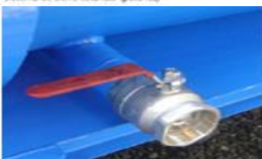
Evacuación de Líquidos