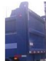
Puerta Tipo Tolva