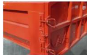
Sistema de cierre Tipo Mariposa