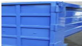
Bisagra apertura lateral