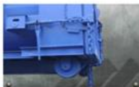
Sistema estanco con tornillos de apriete